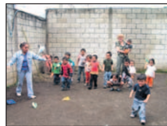
Olifanten verzorgen in Thailand en werken in een crèche in Guatemala.