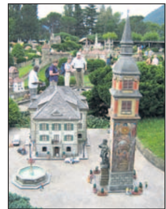
Monument van nationale held William Tell in Altdorf in Swiss Miniatur.